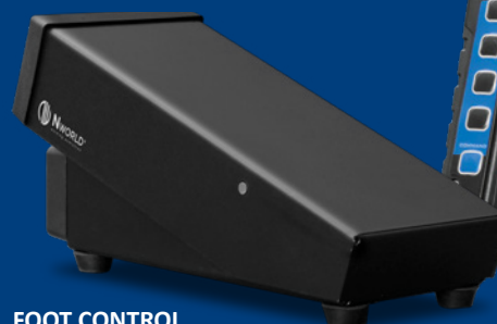
FOOT CONTROL Code DCTW00002

Fino a 20 metri di distanza Up to 20 meters away