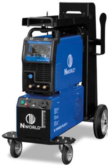
Versione con sistema di raffreddamento Water cooling system version