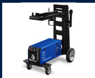
Sistema di raffreddamento WPOWER 8 PLUS completo di carrello

WPOWER 8 Plus cooling system with trolley