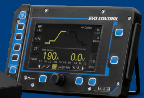
EVO CONTROL Code DCTW00001